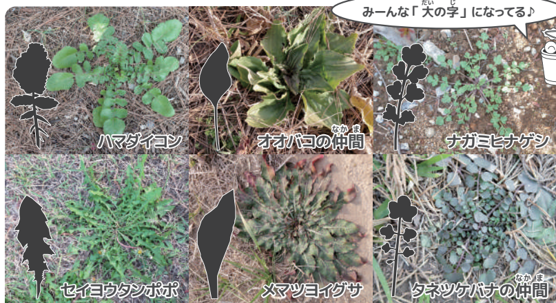
みんな「大の字」になっている!