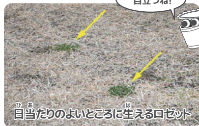
目当たりのよいところに生えるロゼット

さて、ここで学習館の近くで見られるロゼットを紹介しましょう。一見どれも似ていますが、すべて別種です。一枚一枚の葉っぱの形に種類ごとの特徴があります。慣れてきたらパッと見分けられるようになりますよ!